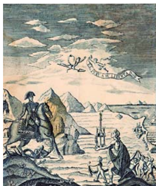
M. Cabello. Lima al Libertador , 1825

Volviendo al ámbito local, otro dominico criollo, fray Miguel Adame, llegaría a ser reconocido como el grabador más notable y prolífico de Lima durante el primer tercio del siglo XVIII. En 1701 logró captar una excepcional vista interior de la imprenta limeña de José de Contreras y Alvarado. Se ve allí a Contreras dirigiendo su taller tipográfico, consciente de la dignidad que implicaba su cargo de «impresor real». En los años siguientes, Adame abordará una diversidad de temas ligados a las altas esferas oficiales y académicas. Su cercanía con el célebre erudito Pedro de Peralta y Barnuevo, lo llevará a ilustrar varias de sus obras con efigies y composiciones alegóricas. Para la Historia de España Vindicada (1730), Adame buriló un ciclo de retratos