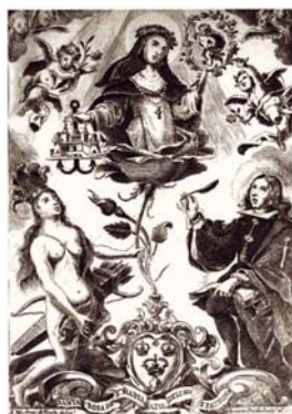
Santa Rosa, Madrid, 1711.