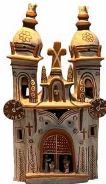
Iglesia de Quinua

En 1975, la concesión del Premio Nacional Fomento de la Cultura, en la categoría de arte, al retablista ayacuchano Joaquín López Antay marcó -más allá de la polémica-, un hito en el reconocimiento a la creatividad de los artistas populares del Perú, cuyas obras venían alcanzando en nuestro país un creciente prestigio y empezaban a ser valoradas en el exterior. Mamerto Sánchez tenía por esa época algo más de treinta años y estaba en plena efervescencia, haciendo sus inconfundibles aportes. En 1984, tras el estallido de la violencia terrorista y en medio de los conocidos padecimientos que hubo de soportar, en especial, su región, migró a Lima, donde se estableció con parte de su familia en el distrito de Ate Vitarte. Pero incluso en esa nueva experiencia permaneció fiel a la tradición artesanal aprendida en Quinua, donde conservó también su casa taller. En el tráfago capitalino, mantuvo iguales técnicas y materiales, se agenció la misma arcilla y los mismos pigmentos naturales, con las sencillas herramientas de siempre -carrizos, plumas, palitos-, y aprovechó la perspectiva que otorga la distancia para nutrir su inventiva ahondando en las tradiciones de su pueblo. Los reconocimientos empezaron a multiplicarse. El año