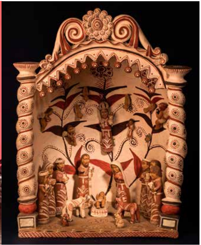
A la izquierda: Virgen de Cocharcas, La Última Cena y otras figuras. A la derecha: Nacimiento