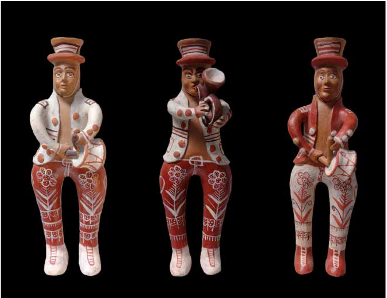
Músicos uniformados. En la portada: sirena con charango