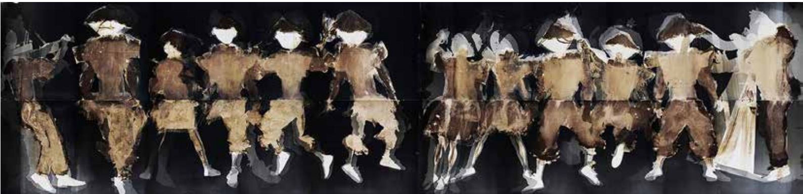
Danzantes de tijeras