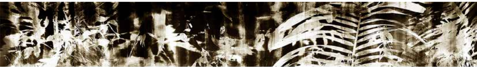
Amazonograma nº 5 (detalle)