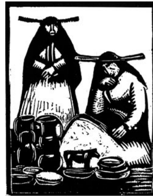
José Sabogal. Pucará . Grabado, 1927